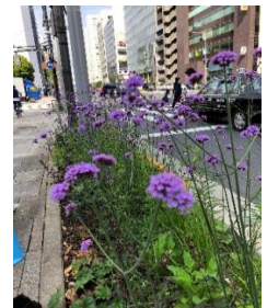
絵画館銀杏並木前