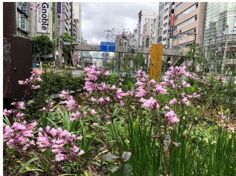
宮益坂上交差点 交通島