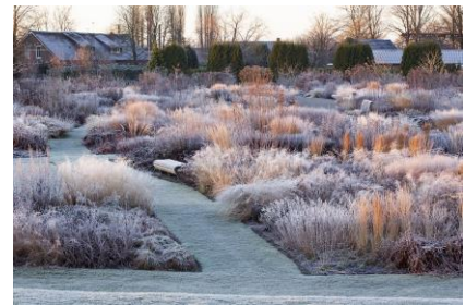
ナチュラルスティック・ガーデンの事例（オランダ）